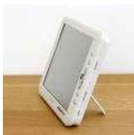
Mit integrierten Standfuß

Mit dem größten Gerät der MySpeaker Produktlinie ermöglicht es auch Personen mit größeren motorischen Defiziten sich zu verständigen.